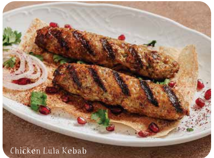
Chicken Lula Kebab