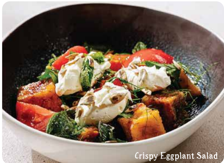
Crispy Eggplant Salad

A mixed salad with juicy tomatoes and crisp cucumbers, available with or without crunchy nuts سلطة مشكلة مع الطماطم الطرية والخيار المقرمش، تقدم مع المكسرات المقرمشة أو بدونها